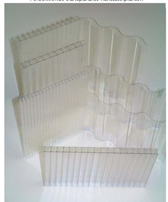
Verschillende transparante kunststofplanten

(bron: Hemming S., 2004, optimaal gebruik van natuurlijk licht in de glastuinbouw )