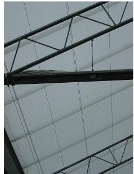
Kasdek met zigzag platen